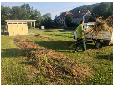
Schnitt wird nach ca. 5-10 Tagen abgeräumt

Wiesen auf mageren Standorten können 1-mähdig bewirtschaftet werden, der ideale Schnittzeitpunkt ist hier der Spätsommer. Säume werden ebenfalls 1-mähdig bewirtschaftet, ein Schnitt im Spätherbst oder im zeitigen Frühjahr ist ausreichend. Das Mahdgut bitte von der Fläche entfernen.