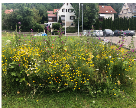
Blumenwiese mit schöner Vielfalt bei zweimaligem Schnitt