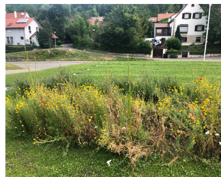
Eingeschränkte Vielfalt bei einmaligem Schnitt im Oktober